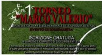
Torneo Marco Valerio

L'evento ha uno scopo benefico ed è nato per aiutare i bambini affetti da patologie molto aggressive dei quali il Fondo di assistenza si occupa nel contesto del piano cronici